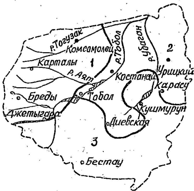
Рис.1. Районирование бассейна Верхнего Тобола на основе зависимости снегозапасов от географических координат местности: 1,2,3 – номера районов

в 46 пунктах наблюдений, из которых 42 расположено в Костанайской области, два (Бреды, Карталы) на территории Российской Федерации, в пределах рассматриваемого бассейна, по одному в Актюбинской и Торгайской областях (соответственно Северный АМСГ и Шили). По этим данным были установлены районные зависимости снегозапасов на конец февраля и максимальных предвесенних снегозапасов от географического положения пунктов наблюдений. Границы районов показаны на рис.1. Для февральских и максимальных снегозапасов они почти совпадают и в основном согласуются с физико-географическим районированием территории [1,2].