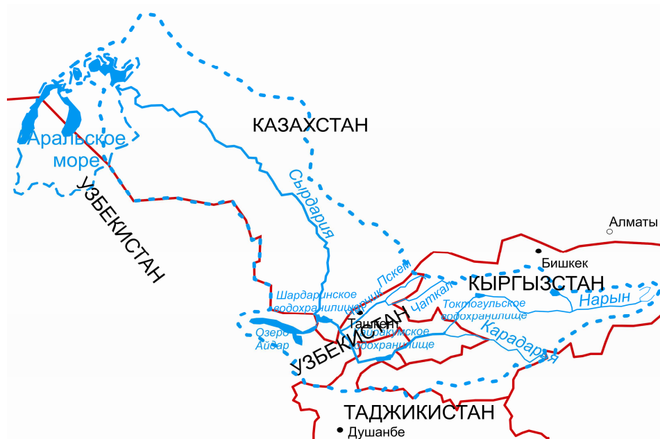
Рис. 1. Схема бассейна р. Сырдарья.

Главная река Арало-Сырдарьинского ВХБ – р. Сырдарья – по водоносности занимает второе место в Центральной Азии после Амударьи, и протекает по территории четырех государств (Кыргызстан, Таджикистан, Узбекистан и Казахстан, рис. 1). Ее нижнее течение является главной водной артерией южного региона Казахстана, где проживают по данным комитета по статистике МНЭ РК около 3,6 млн. человек, т. е. 20 % населения нашей республики [4].