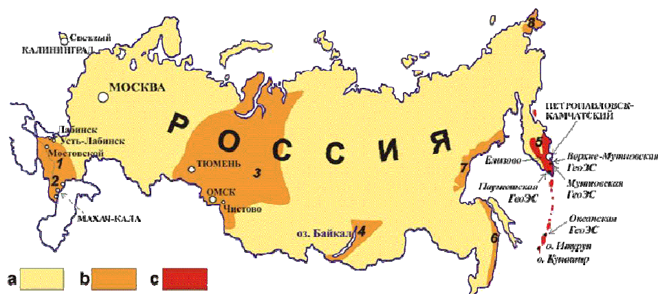
Рис. 4. Геотермическое районирование России. а – районы пригодные для теплоснабжения зданий с помощью тепловых насосов; б – районы перспективные для «прямого» использования; с – районы современного вулканизма наиболее перспективные для «прямого» использования, выработка тепла и электроэнергии на бинарных установках, а также создание крупных ГеоЭС на парогидротермальных месторождениях. 1 – Северный Кавказ (платформенная провинция), 2 – Северный Кавказ (альпийская провинция), 3 – Западная Сибирь, 4 – Прибайкалье, 5 – Курило-Камчатский регион, 6 – Приморье, 7...8 – Охотско-Чукотский вулканический пояс.

вод, полученных из нефтегазовых скважин. Важной вехой в развитии геотермального производства в СССР можно считать 1964 год, когда была создана Северокавказская разведочная экспедиция по бурению и реконструкции нефтегазовых скважин для геотермального теплоснабжения. В 1966 г. в Махачкале было создано Кавказское промышленное управление по использованию глубинного тепла Земли, а в 1967 г. – аналогичное Камчатское промышленное управление в Петропавловске-Камчатском в системе Мингазпрома. Геотермические и геотермальные исследования ведутся в России более чем в 60 научных учреждениях, принадлежащих к различным ведомствам. Геотермальные ресурсы России хорошо изучены [3, 4, 12] (рис. 4).