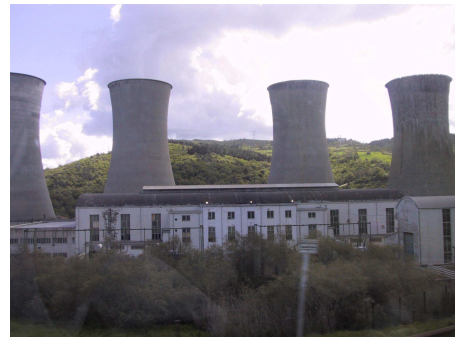
Рис. 2. Геотермальная электростанция в Лардерелло, Италия.

Низкие цены на углеводородное сырье в 70-е годы и кризис 90-х долго затормозили развитие геотермальной энергетики в России. Однако, нынешние высокие цены на нефть и газ требуют незамедлительного развития альтернативной энергетики. Во-первых, невозобновляемые ресурсы быстро истощаются, особенно при нынешнем состоянии экспорта нефти и газа. Во-вторых, на внутреннем рынке цены на топливо неизбежно приближаются к мировым. Экономить энергию придется всеми возможными способами. Отягчающим обстоятельством для развития геотермальной энергетики явится также углеводородная ориентированность Российской экономики. Новые месторождения нефти и газа долго не разведывались и не осваивались, а вновь открытые в Арктике и на шельфе Дальнего Востока экономически малорентабельны. Их освоение потребует огромных затрат, а экономическая целесообразность эксплуатации сохранится только при высоком уровне цен на углеводороды. Даже небольшое снижение мировых цен на нефть и газ, потребует от России огромного напряжения для выполнения взятых на себя международных обязательств по уровню продаж. Предвидя экономические риски, правительство может еще больше сосредоточиться на углеводородном сырье. Разведка, бурение, освоение потребуют новых капиталовложений в нефтегазовый сектор, а геотермальная энергетика может опять оказаться в стороне.