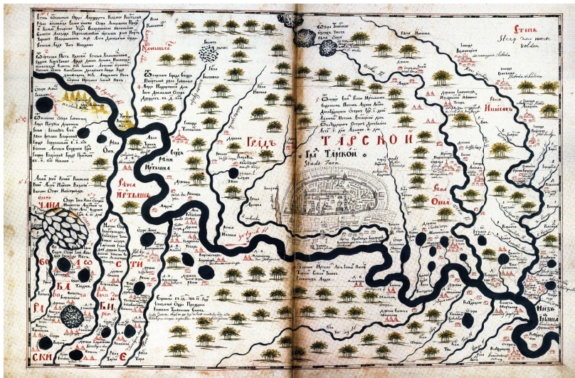
Сурет 1. С.У. Ремезовтың «Сібірдің Сызба» картографиялық еңбегіндегі Ертіс өзенінің бойында орналасқан географиялық нысандар (1697 ж.) [1].

«Кереку жардан батысқа қарай» «Урочище 9-ти бугров», одан әрі «Бакланная заострова, Рыбная», одан әрі «Качир» (Кашыр), 8-яров урочище рыжых жеребцов (Осморыжьск), солтүстікке қарай «Ирлытют Яр» (Үрлітүп), «Сайгачий Яр» (Сайғақ жары) болып жалғасып кете берді. Кереге жардан шығысқа қарай «Верблюжий Яр», «Толокнянные горы», одан әрі «Жәмші» (Ямыш) көлі және т.б. орографиялық және гидрографиялық нысандар бейнеленген деуге болады [1]. Бұл нысандардың барлығы өткен тарихтан мол геоэкологиялық ақпараттар береді. Сондықтан топонимиялық ерекшеліктерді анықтаған уақытта географиялық карталар жиі қолданылады. Өйткені карталарда сандық және сапалы сипаттамалар беріліп, зерттеуге мүмкіндік туындайды [12].